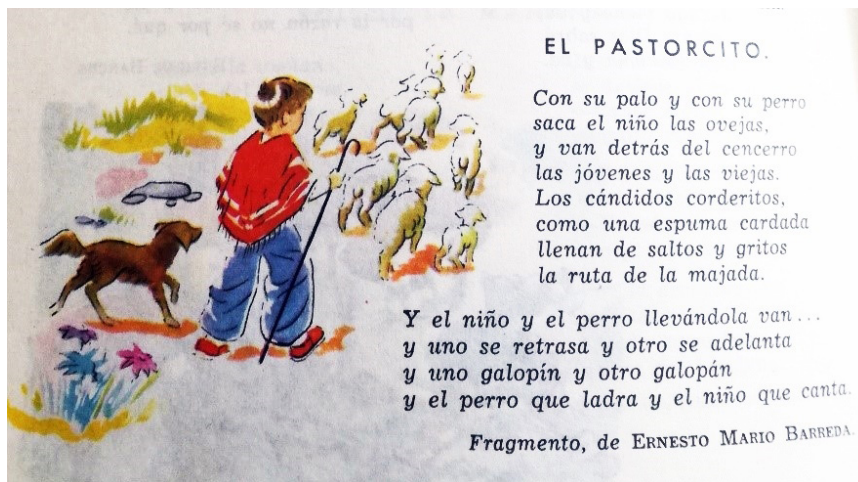
Figura 6. Manual del alumno bonaerense, III grado. Buenos Aires: Kapelusz, 1961, p.180

En otro relato una niña con vestimentas nortteñas entabla una conversación con un hombre al que le interesa saber cómo es el cuidado de las llamas. La pequeña brinda explicaciones que parten de un laboreo cotidiano mostrado sin ambages, como también su integración a un universo cultural determinado.