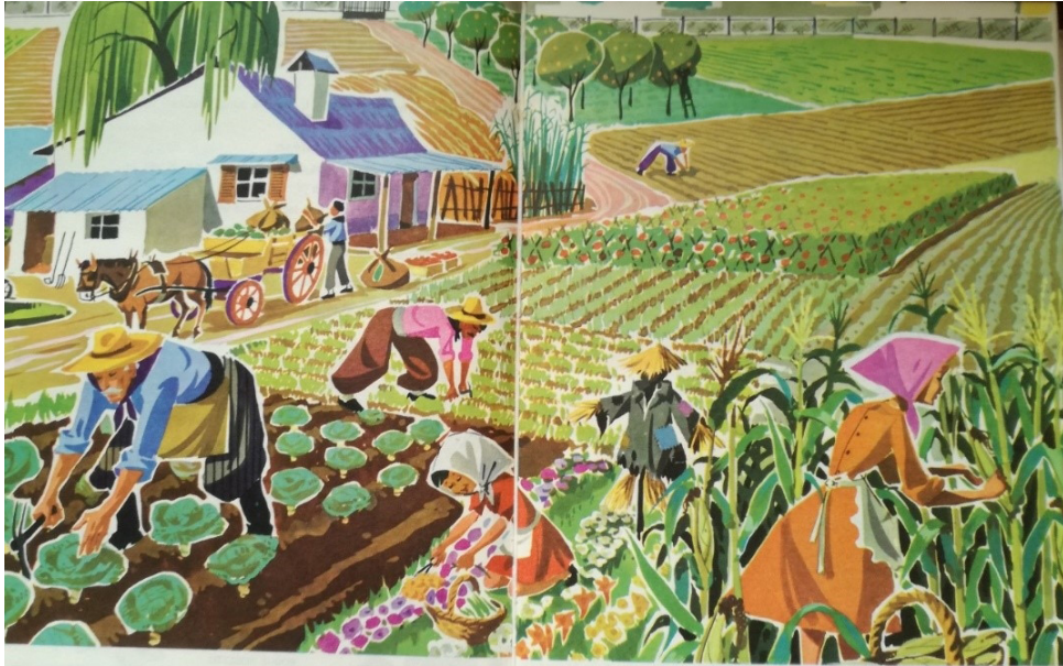
Figura 5. Manual Peldaño, III grado. Buenos Aires: Kapelusz, 1969, pp. 178-179

Estas características pueden encontrarse con especial vigor en las décadas de 1940-1950. Pero es también interesante ver cómo se componen las escenas de trabajo familiar hacia finales de la década de 1960.