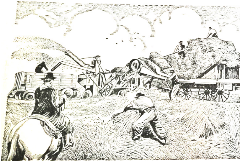
ESCENAS DEL CAMPO ARGENTINO. — La trilla, que actualmente se realiza con máquinas que recorren los campos, es una de las tareas principales en la zona agropecuaria.

En este escenario no extraña que el tema de la propiedad de la tierra reciba un tratamiento periférico, con referencias superficiales. Esto incluso en una etapa en que la colonización agrícola, reforma o transformación agraria, aunque en retirada, ocupaban opiniones expertas y debates públicos más allá de la Argentina.