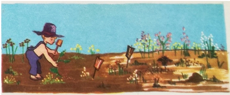
Figura 4. Manual Nueva Escuela, III grado. Buenos Aires: Peuser, 1965

La composición de las ilustraciones, no obstante, supone la introducción de un sujeto infantil no carente de estereotipos. En varias oportunidades aparecerán niños de reglamentario jardinero 34 que emulan el contacto con el campo, aunque no pueda decirse que efectivamente parezcan habitarlo (Figura 4). En efecto, nada hace pensar que esas referencias remitan a una niñez rural, parecen más bien pequeños de entornos urbanos que disfrutan la campiña, pues perciben sus beneficios en actitud alegre y despreocupada 35 .