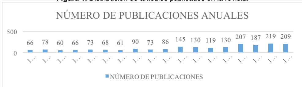
Figura 1. Distribución de artículos publicados en la revista.

Además, la comparación entre la media de las dos etapas señaladas nos revela un gran aumento de las publicaciones, siendo muy superior la media en la segunda etapa que en la primera (67'42-145), una diferencia de 77'58 puntos.