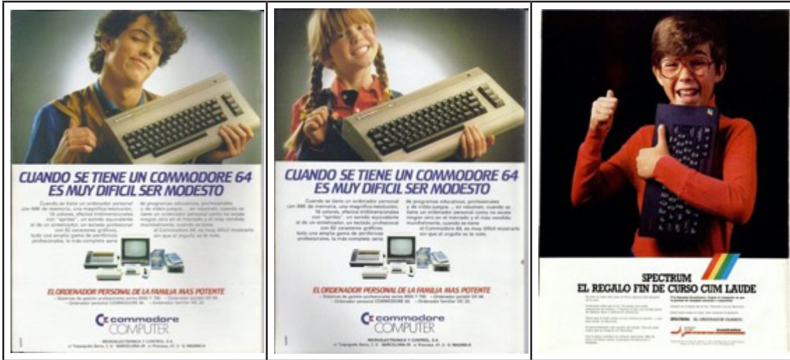
Imagen 5. Anuncio 1a y 1b (Commodore 64) y 11 (Spectrum)