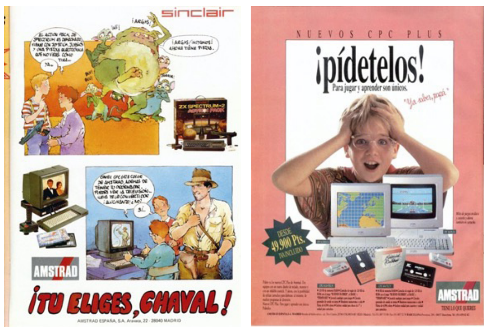
Imagen 6. Anuncio 40 (Spectrum-Amstrad) y 42 (Amstrad)