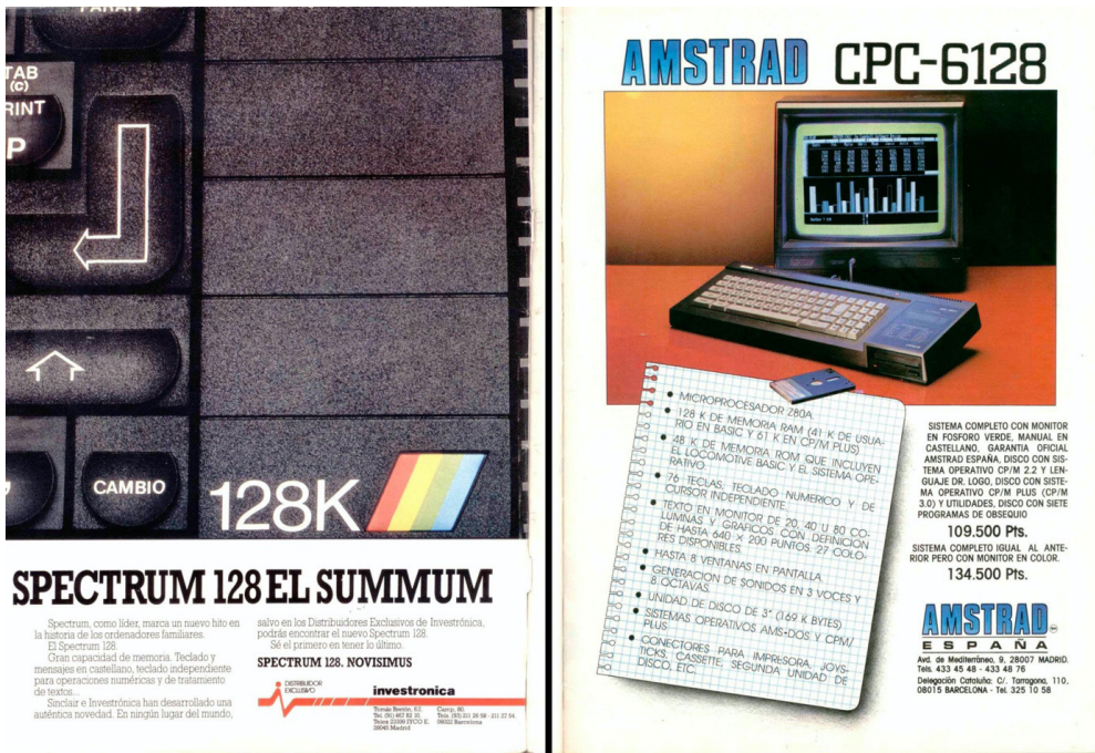
Imagen 2. Anuncios 11 (Spectrum 128) y 12 (Amstrad CPC-6128)