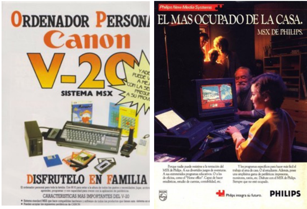
Imagen 7. Anuncio 18 (Canon V-20) y 28 (MSX)