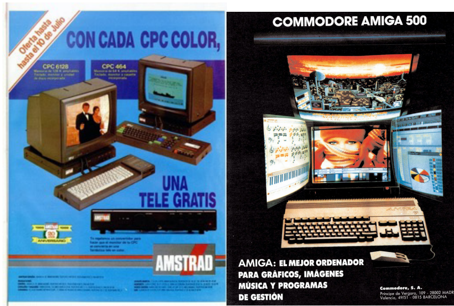
Imagen 4. Anuncio 32 (Amstrad) y 39 (Commodore Amiga 500)